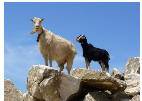
Ziegen, überall Ziegen!