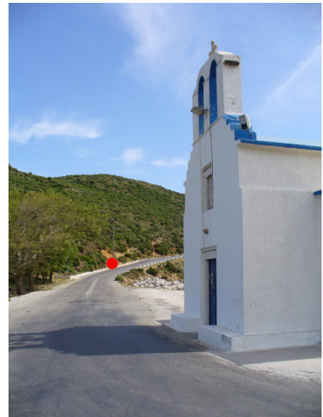
Die Kapelle Stavrós. Einstieg der Wanderung beim roten Punkt

Bei einer Gabelung (N 37° 07' 18.2'' E 25° 31' 29.7'') wendet man sich rechts. Links oben liegt der Gipfel der Kóronos (999m). Stachelige Polster lassen den Aufstieg von hier weniger ratsam erscheinen. Außerdem hängen genau an diesen Polstern Zecken, die von den Tieren abgestreift wurden und nur drauf warten, sich an dem nächsten Warmblüter gütlich zu tun. Tief im Norden liegt das Dorf Skadó. Weiter im Osten erstreckt sich Koronós, aus dem sich früher ein Großteil der