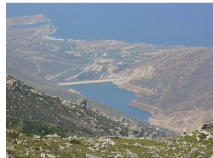
Stausee bei Faneroméni

Der weitere Weg endet nach kurzer Strecke bei einem Gemäuer (N 37° 07' 50.6" E 25° 31' 07.9"). An dem geht man rechts vorbei und dann immer weiter und jetzt pfadlos etwa auf gleicher Höhe bleibend auf dem oder kurz unterhalb des Kammes des Bergrückens. Relativ locker wachsende stachelige Polster erlauben ein passables Durchkommen. Auch ein Zaun aus Betonstahlmatten lässt sich mit Gespür an der richtigen Stelle leicht durchqueren. Links tief unten erscheint nach einiger Zeit der Stausee von Faneroméni, das größte, im Jahr 2003 fertiggestellte Wasserreservoir von Naxos. Nach ein paar hundert Metern weiter auf dem Kamm erscheint wiederum links unten das fruchtbare Tal von Mirísis. Es gehört zu Komiakí und viele seiner Bewohner bauen hier Wein an.