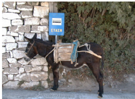
Bushaltestelle in Komiakí

Nach etwa einer halben Stunde erreicht man die ersten Häuser von Koronís , dessen alter Name Komiakí noch immer benutzt wird. Die Hauptkirche des Ortes – Theoskepástis /Taxiárchis/Agios Artémios – mit ihrer blauen Kuppel und blaugekuppeltem Turm erreicht man leicht durch die verwinkelten Gassen. Direkt daneben liegt die Taverne Liayaóris (N 37° 08' 44.8" E 25° 31' 48.3"), bei der man Wein und Käse des Hauses genießen sollte.